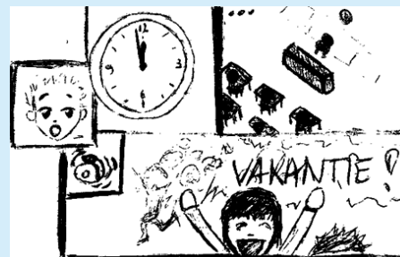
"Getekend door Isabelle Billiet"