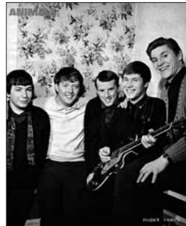
The Animals genoten er blijkbaar net zo van als wij.

We zetten "House of the rising sun" van "the Animals" in en daar komt onze volgende die-hard fan aangezwalpt. Neen, geen domme woordkeuze, want onze vraag of hij kan zingen, beantwoordt hij (ditmaal in het Frans): "Non, non, je suis trop (maakt een grijpend gebaar naar zijn neus)." Na geconstateerd te hebben dat deze man ofwel "te neus" is ofwel gewoon ladder-zat, gaan we rustig door met spelen en vergenoegen zo een groepje kaarters met hemelse muziek.