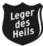
Het logo van de organisatie.

Op 17 januari worden we in deze arme buurt ontvangen in het opvangcentrum van het Leger des Heils. Een gemotiveerde medewerker die er net de nachtdienst op heeft zitten en enkele levenloze zielen verwekomen ons.